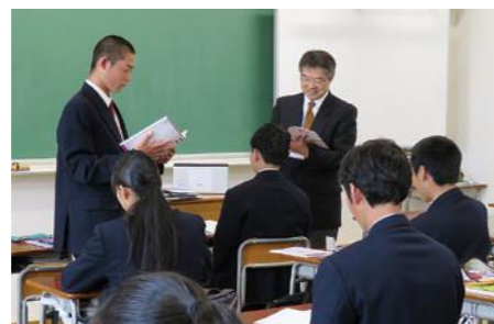
教師の問いかけが生徒の学習意欲を養います。