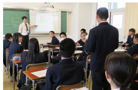
毎時間充実した授業です。

勉強も部活動も頑張りたい! そんな生徒のために、進学に向けて十分な学習時間を確保しつつ、放課後は自分を磨くための時間を用意しています。特技や運動能力を伸ばしたい生徒は部活動、自分のペースで学力を伸ばしたい生徒は課題学習、学力をさらに高めたい生徒は尽誠塾と、それぞれの目指す方向を見据えて頑張ることができます。