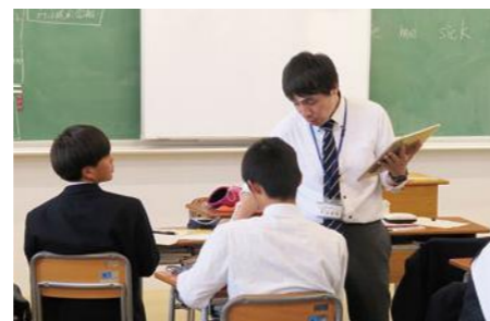
興味深い内容の授業が生徒の好奇心を刺激します。